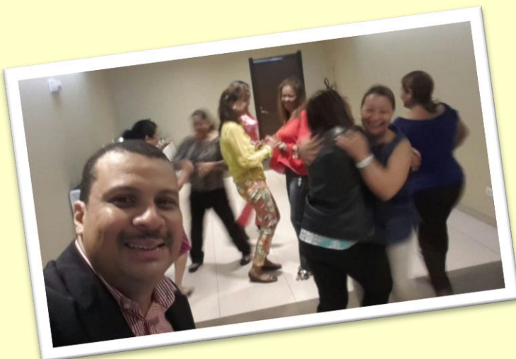
Reuniones de trabajo del Comité Organizador, Relaciones Públicas y Junta Directiva